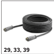
29, 33, 39